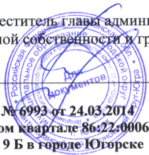
Схема расположения земельного участка № 6993 от 24.03.2014 на кадастровом плане территории в кадастровом квартале 86:22:0006001 расположенного по улице Промышленная, 9 Б в городе Югорске для размещения производственной базы